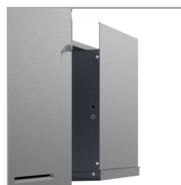
Monobloková zadní strana – bez připojení k panelu