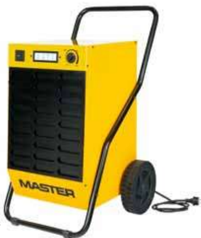
DH 44 DH 62 DH 92