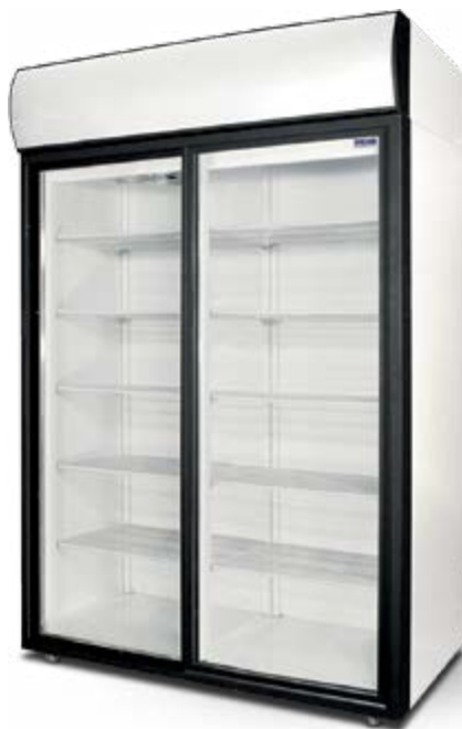
DM 114 SD