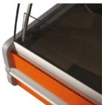
▸ detail předního skla